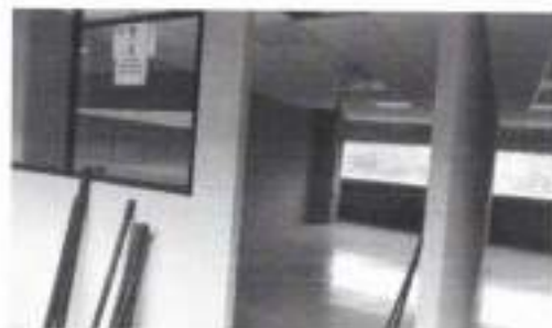
Figura 2: Laboratorios (noviembre), segundo piso.