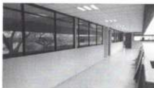
Figura 4: Salones; segundo piso(noviembre), segundo piso.