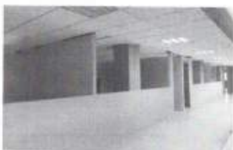
Figura 3: Salones; segundo piso (septiembre), segundo piso.