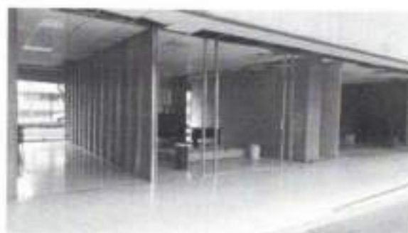
Figura 5: Espacios: planta baja.