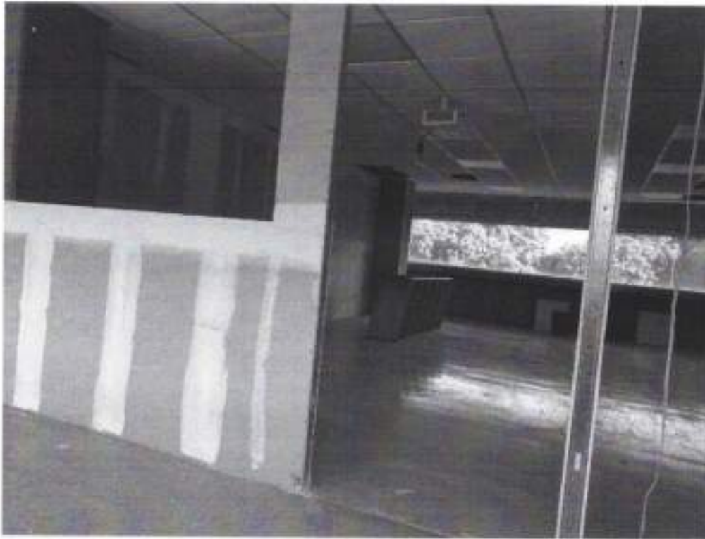
Montaje de divisiones sin acabados (septiembre 2021)