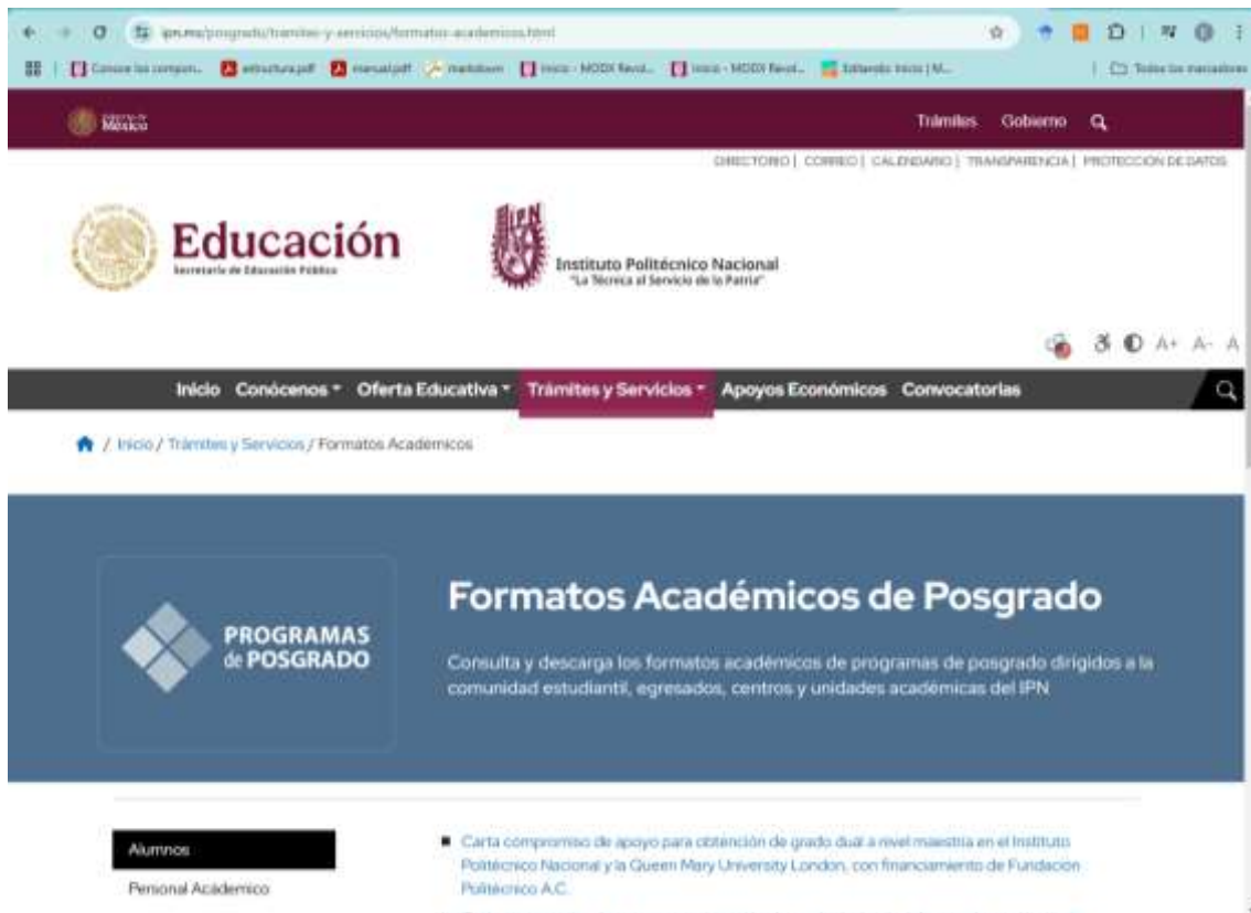
Figura 2. Página de la Dirección de Posgrado para descargar los formatos SIP-1, SIP-2, SIP-5 y SIP-6