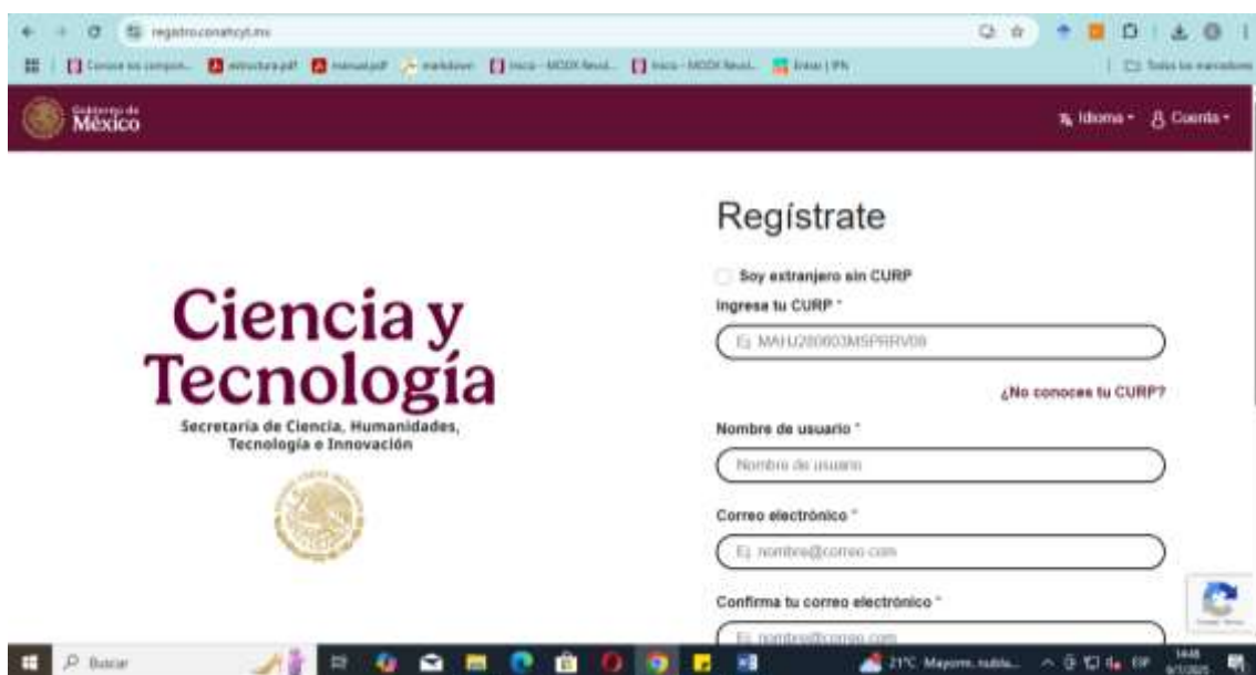
Figura 3. Página de CONAHCYT para registro.